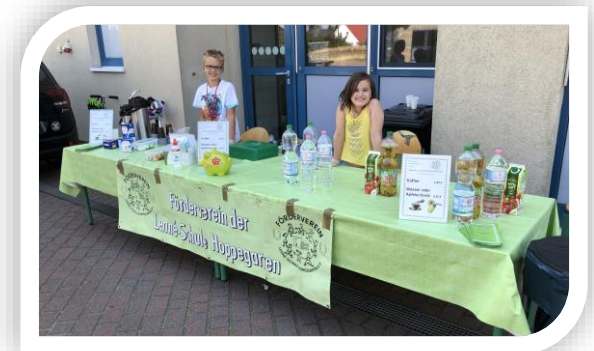
Getränkestand zur Einschulungsfeier